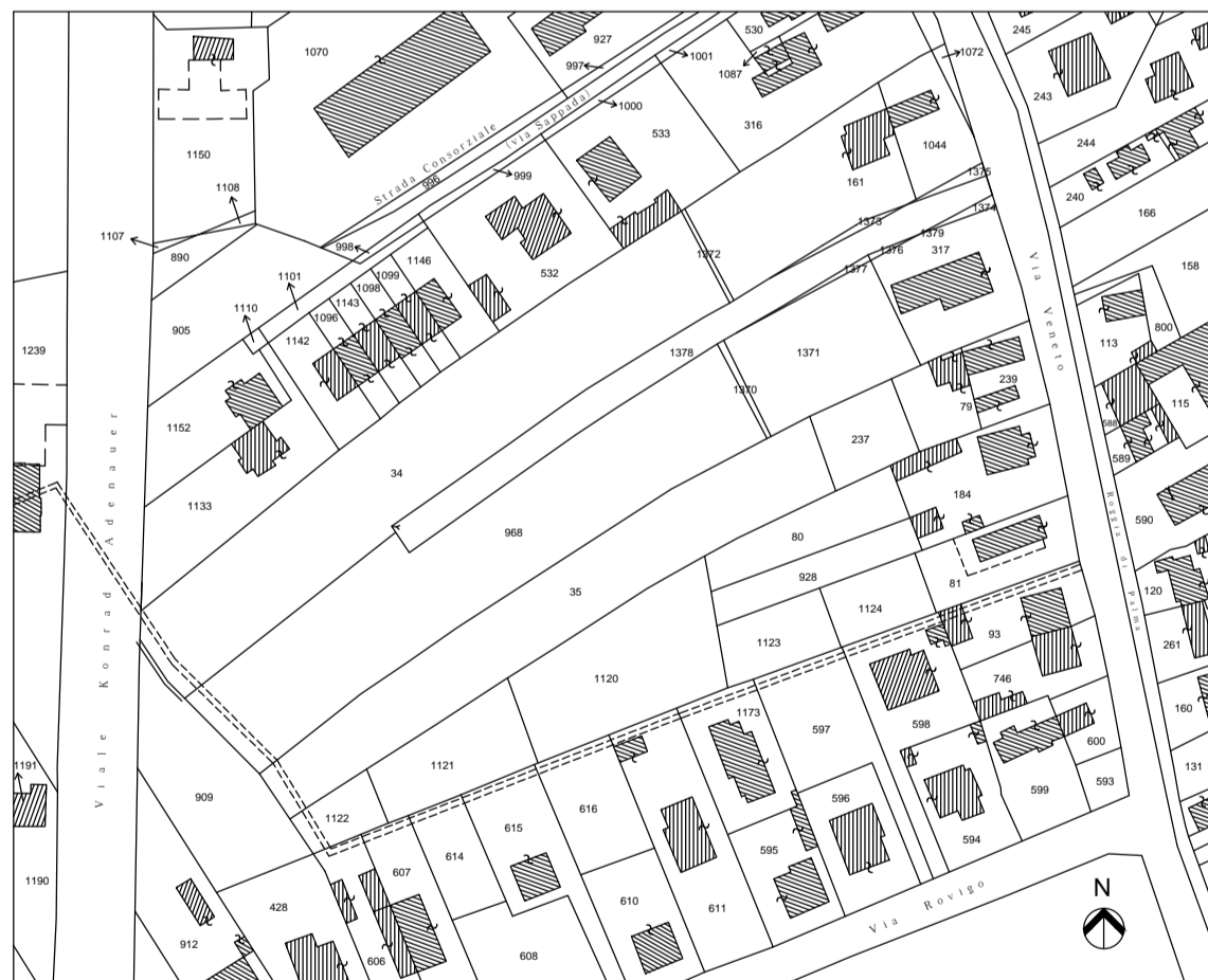
COMUNE DI UDINE Foglio n. 61- mapp. n. 34, 35, 237, 968, 1121, 1370, 1372, 1373, 1374, 1378